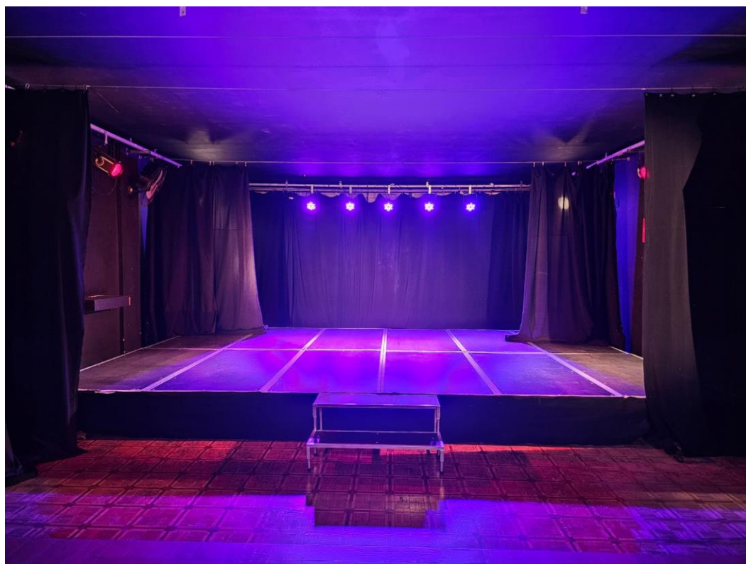
Palco 6m profundidade por 4,20m largura. 3m de altura.