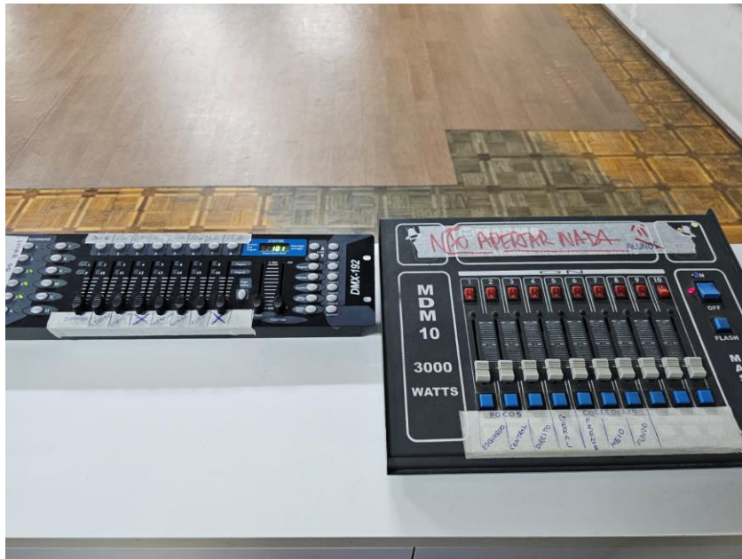
Mesa de Iluminação