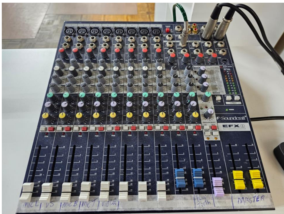
Mesa de Som